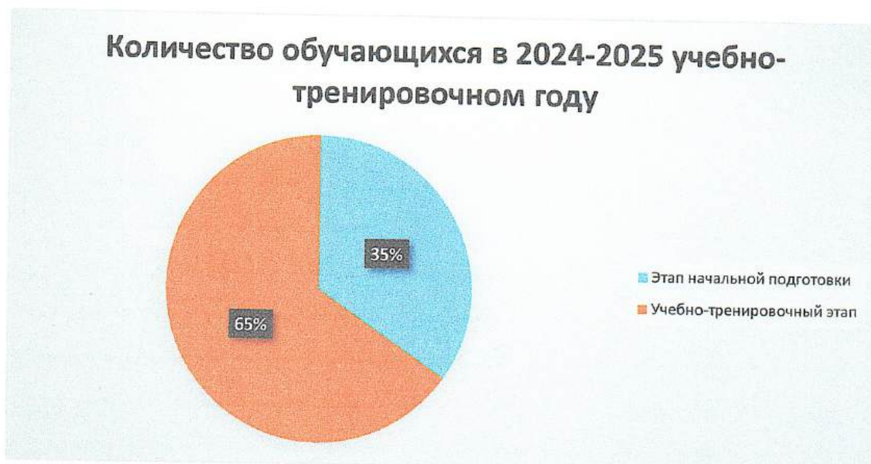
Рисунок 1 – Распределение обучающихся по этапам подготовки

Численность обучающихся, по сравнению с прошлым годом снизилась. Это связано с количеством обучающихся, включенный в муниципальное задание учреждения.